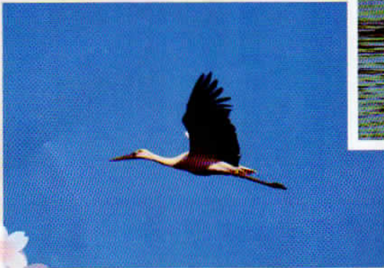
(農業公園前の堤防)